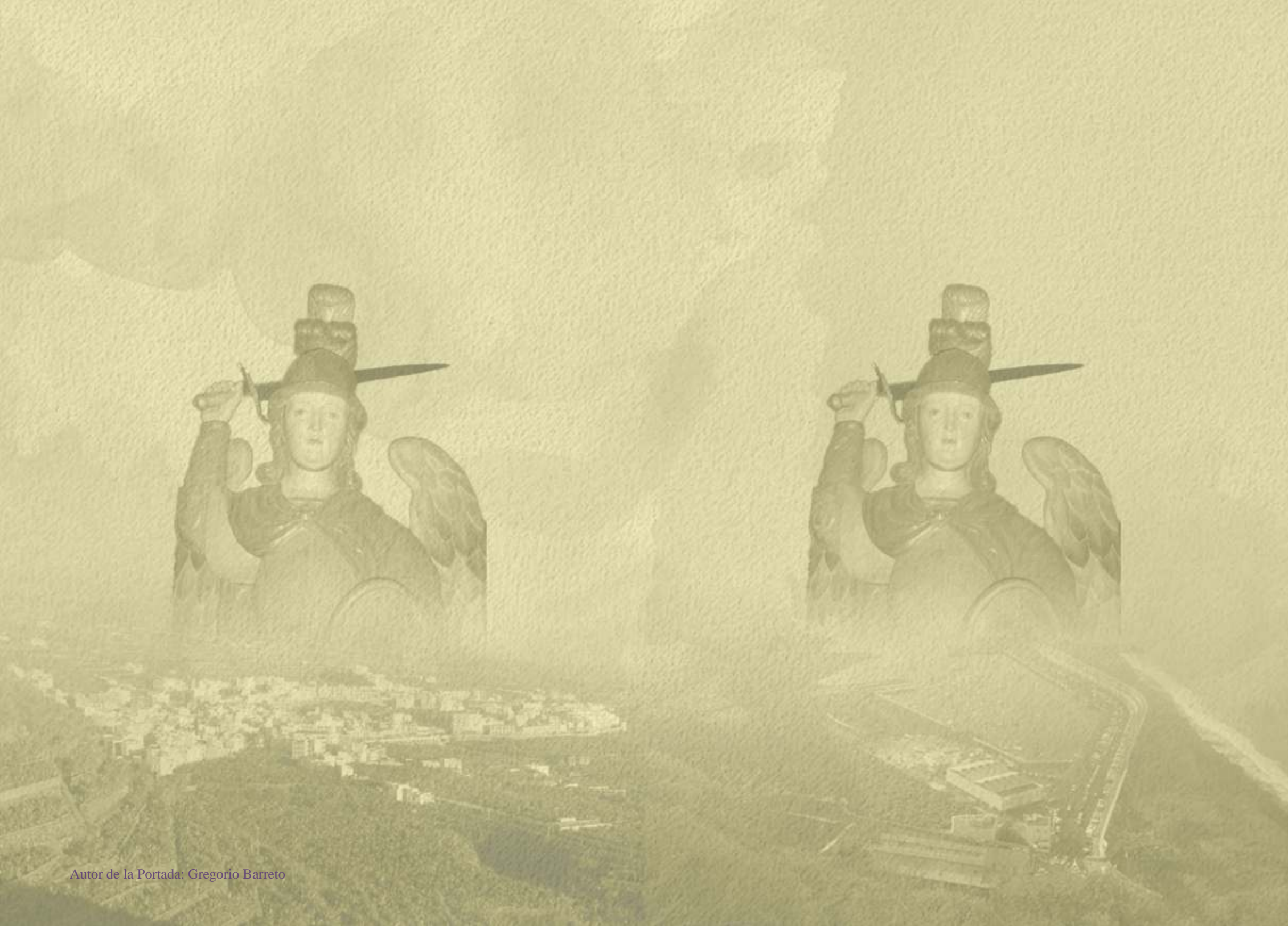
Autor de la Portada: Gregorio Barreto